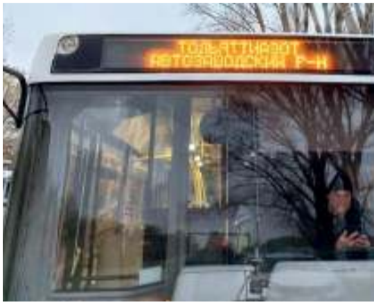
На работу и домой работников ТОАЗа доставляет 31 автобус по 27 маршрутам

Как пояснил наш собеседник, корпоративные автобусы не за-