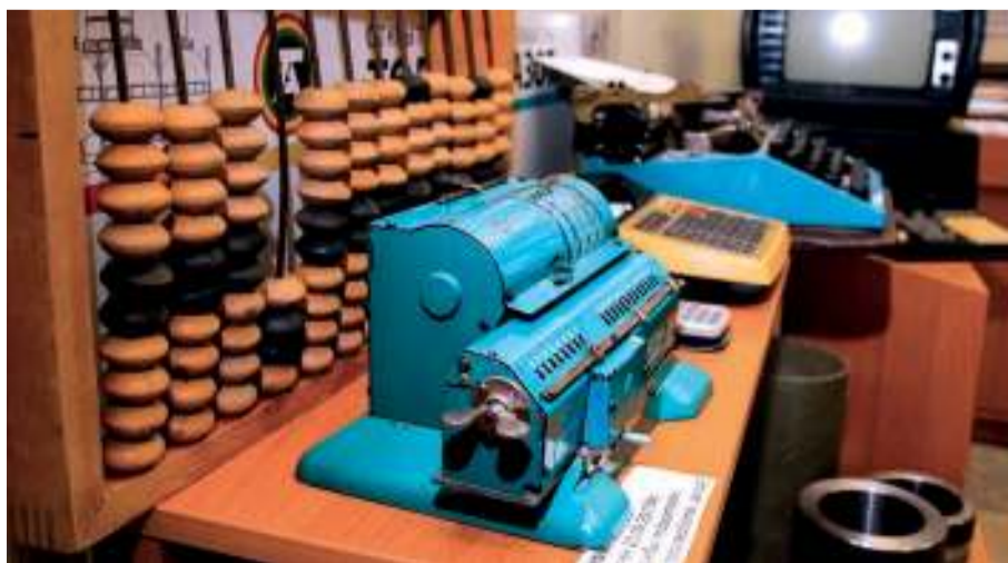
На фото арифмометр и счёты – помощники бухгалтеров в расчёте зарплат первым тоазовцам

В России много оригинальных корпоративных музеев. Один из них посвящён истории становления и развития калийной промышленности и компании «Уралкалий». Он создан на двух площадках в Пермском крае – в городах Соликамске и Березниках. У музея трёхмерная концепция: на 245 кв метрах показаны прошлое, настоящее и будущее предприятия. Витрины выполнены в форме кристаллов, в инсталляциях соседствуют макеты калийных шахт 30-х годов прошлого века, детали современных горных комбайнов и даже интерактивная калийная лаборатория. Как и на Тольяттиазоте, многие экспонаты попали в музей из личных фондов калийщиков. В основе экспозиции в Березниках – образцы маркшейдерского и геологического оборудования, геологическая и палеонтологическая коллекции. Мультимедийная часть выставки дополнена виртуальной реальностью.