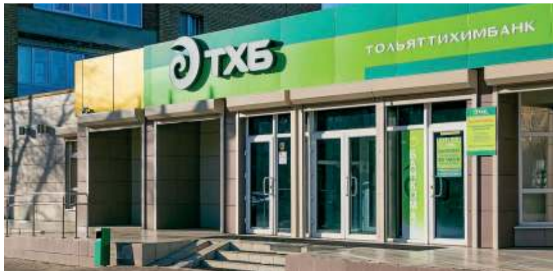
Тольяттихимбанк предлагает банковские услуги всему бизнес-сообществу города и физическим лицам – в первую очередь, сотрудникам партнёрских организаций и предприятий

Ни одно обращение не останется без ответа!