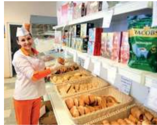
Ассортимент в заводском буфете оценивают каждый день

– Это будет несложно, современная техника позволит справиться за несколько минут, – заверил представитель транспортного цеха. – Потенциальные поставщики определены, рассматриваются технические характеристики LED-панелей.