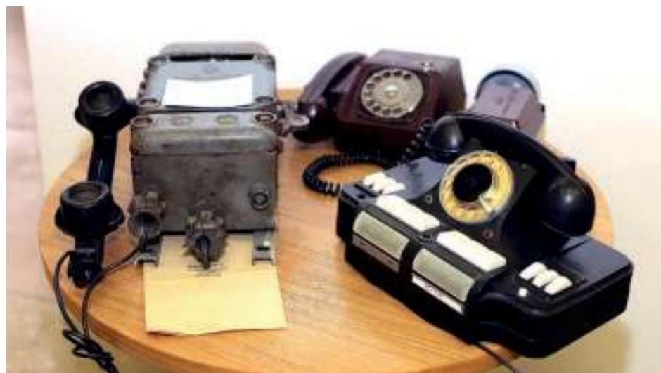
Такие ретротелефоны стояли на столах руководителей завода